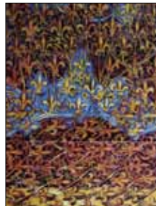
1991 Saint Julien- le-Montagnier