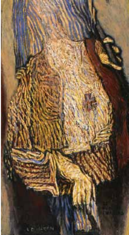
"Le porte-étendard" 100 x 0,50 collection particulière

« Le théâtre de ma vie, j'avais à me venger »