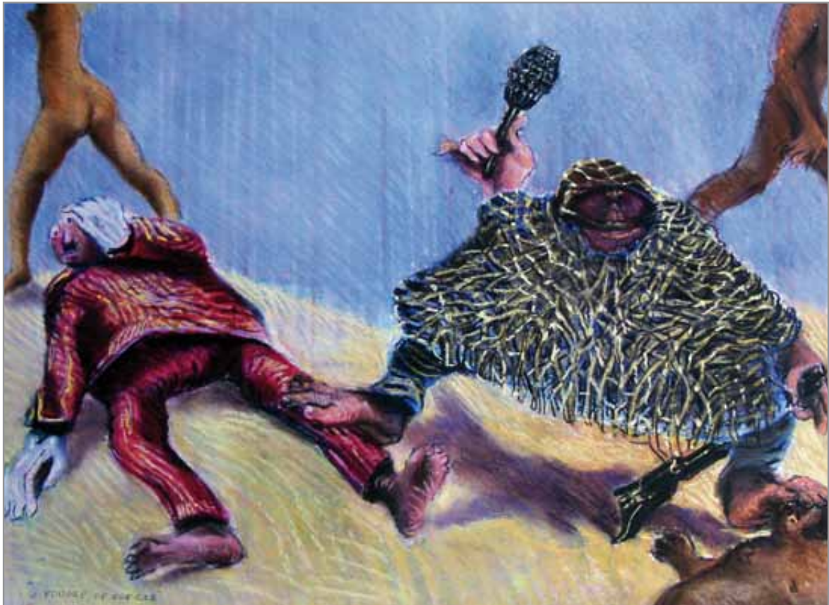
"Le foudre de guerre" 65 x56 cm, 1973, collection particulière