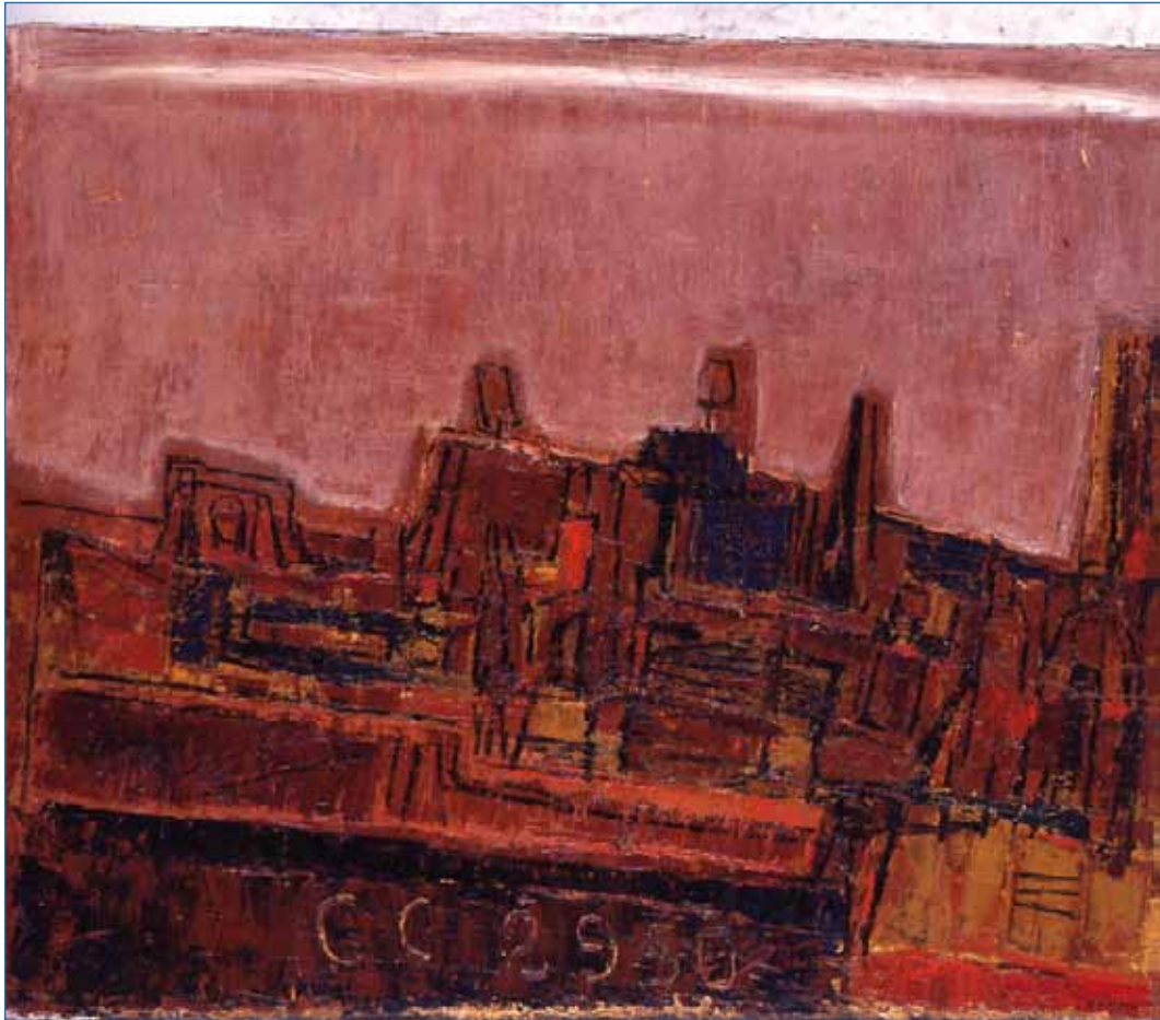
"CC2950" "Second prix du Dôme 1959, 75 x 95 cm, , collection particulière

1957, enfin le peintre face à son public