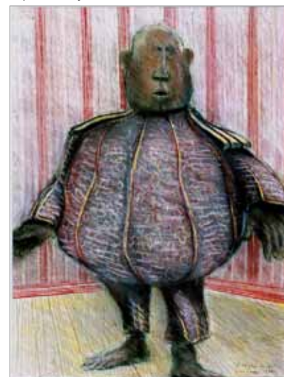
" Il est plein de lui " pastel, 1972

inspiré par la catastrophe de la raffinerie de Feysin, le 4 janvier 1966