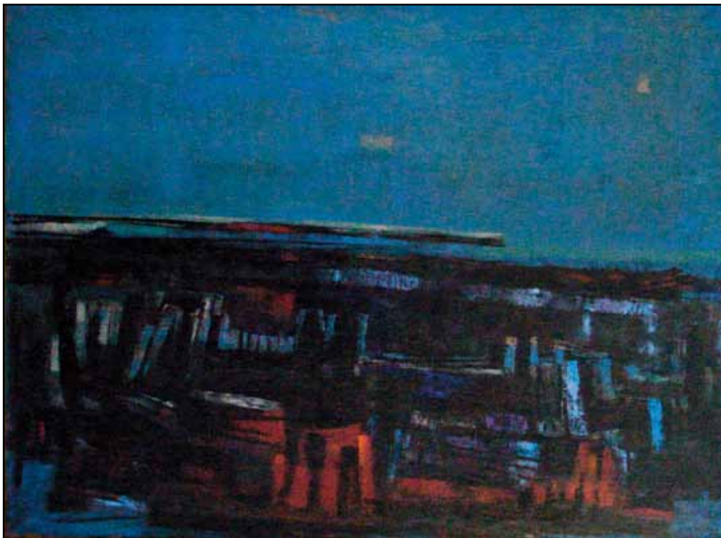
"Paysage marin aux épaves", 1958 120 x 94 cm, , collection particulière