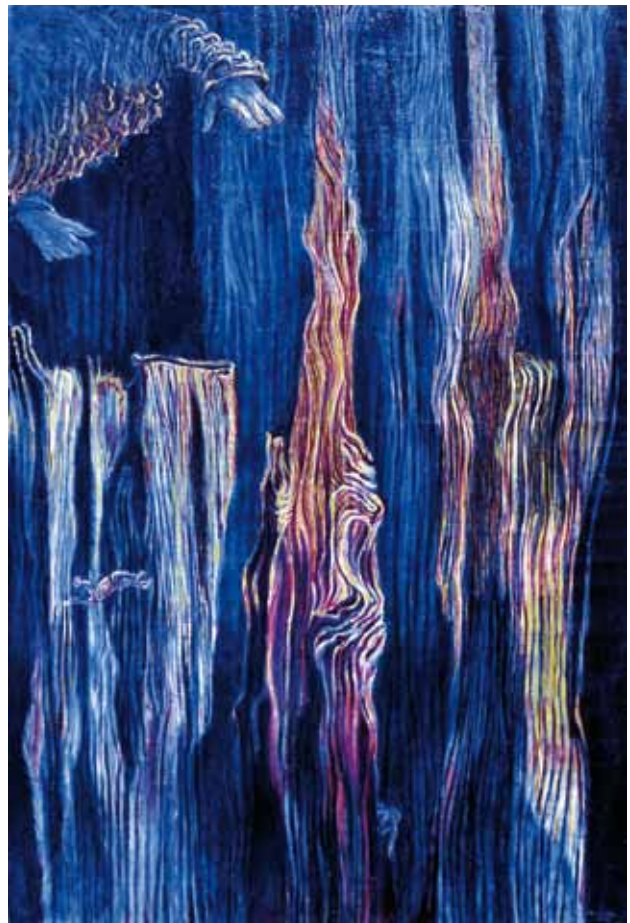
" Itinérante dans des espace infinis 198 x 132 cm,

texte introductif à l'exposition de la Galerie de l'Abbaye en mai 1975.