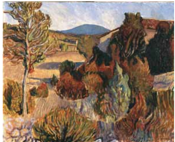
“ L'été au Courcoussier “