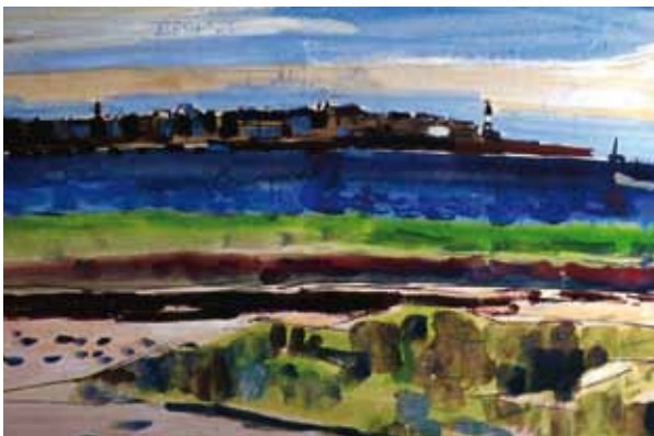
" Vue sur l'île de Sein "1947