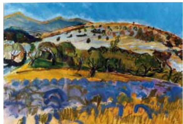
" Aquarelle au Courcoussier "