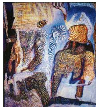
" Personnage sautant sur une mine, ou l'Explosion " 148 x 175 cm,

Pierre Cabanne Paru dans Combat, le 3 novembre 1969